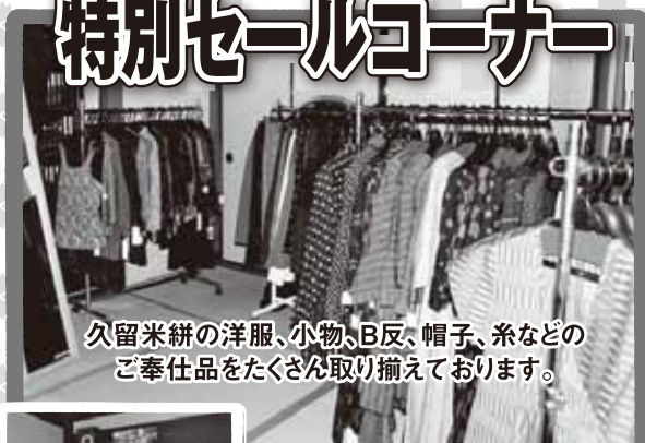
久留米絣の洋服、小物、B反、帽子、糸などの ご奉仕品をたくさん取り揃えております。