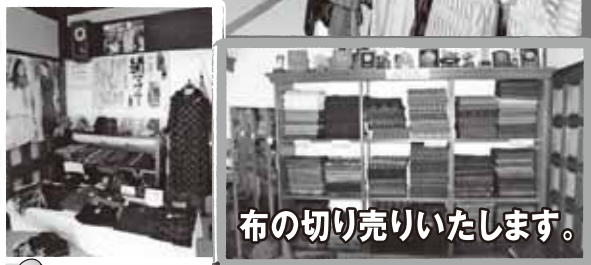
布の切り売りいたします。