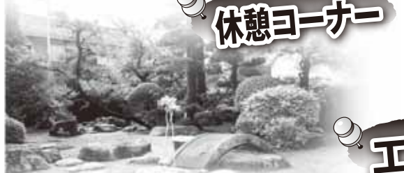
新緑の庭を眺めながら、新茶とお菓子で ごゆっくりお過ごしください。