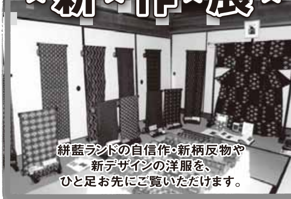
絣藍ランドの自信作・新柄反物や 新デザインの洋服を、 ひと足お先にご覧いただけます。